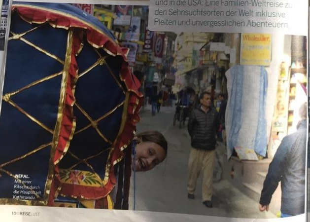
NEPAL Mit einer Rikscha durch die Hauptplatz Kathmandu.

Von Südafrika nach Indien, Nepal, Südostasien und Australien bis zu den Cook-Inseln und in die USA: Eine Familien-Weitreise zu den Sehenswürdigkeiten der Welt inklusive Pleiten und unvergesslichen Abenteuern.