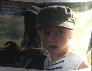
SÜDAFRIKA Im Marakele-Nationalpark auf einer Jeep-Safari.