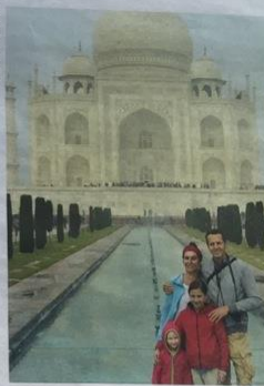
TAJ MAHAL „Wie eine göttliche Erscheinung“, beschreibt Bettina Pohlmann den Taj Mahal in Agra/Indien.

Marina Bay Sands in Singapur. Allein die Anfahrt ist ein Erlebnis, denn das Hotel sieht aus wie ein überdimensioniertes Raumschiff auf drei Stelzen mit gigantischem Surfbrett auf dem Dach. Dieses Surfbrett in zweihundert Meter Höhe ist ein Infinity Pool, der im Nichts zu enden scheint, der höchste Hotelpool der Welt. Da wollen wir rein! Einmal nur, ein einziges Mal, und danach wieder in Hütten schlafen und gerne auch in einem Zelt (...). Das meistgenutzte