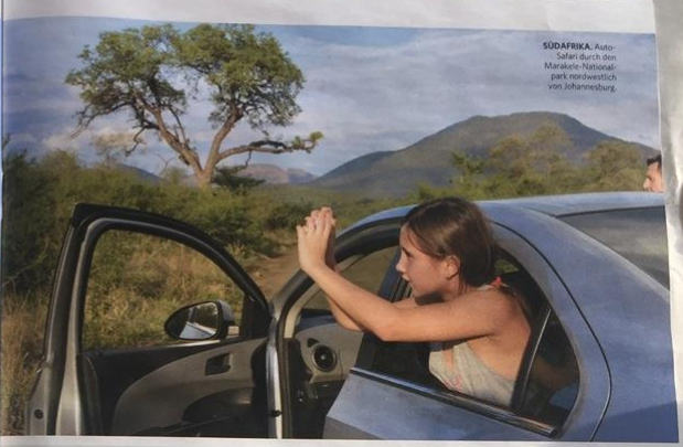
SÜDAFRIKA Auto-Safari durch den Marakele-Nationalpark nordwestlich von Johannesburg.