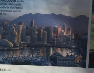
VANCOUVER In der westlichen Metropole schickte die Familie das Viertel am Ende.