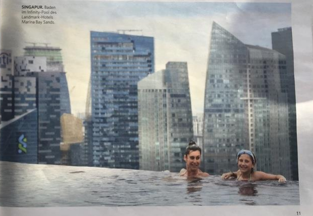
SINGAPUR Baden im Infinity-Pool des Landmark-Hotels Marina Bay Sands.