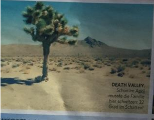
DEATH VALLEY Schon im April musste die Familie hier schwitzen. 32 Grad im Schatten!